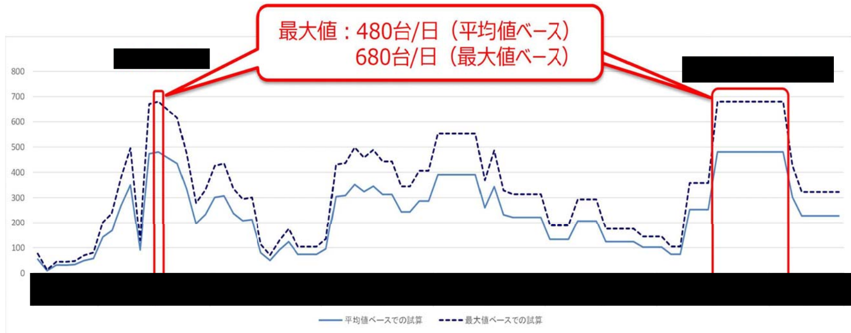
図 6-1 月別・日あたり工事車両運行台数（全車種合計・上下方向合計）の推計値